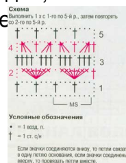
Схема позаимствована из журнала "Маленькая Диана" №3 за 2002 год.

Сборка : сшейте плечевые швы, вшейте рукава. Затем сшейте боковые швы и